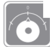
Regulación de la temperatura