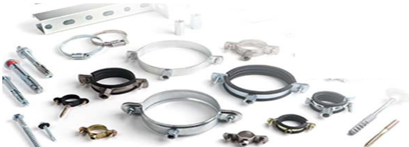
ABRAZADERA -L- M6