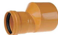
REDUCCION TEJA M-H