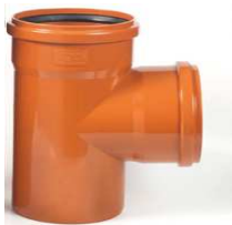
CODO TEJA 87° M-H