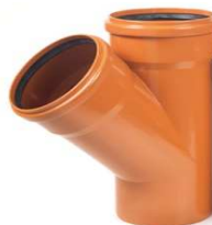
TE TEJA 45° M-H