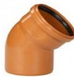
CODO TEJA 45° M-H